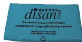
worki na śmieci ER 627