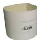
kartonowy rozpinacz worka ER 624