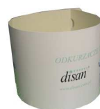
kartonowy rozpinacz worka ER 624