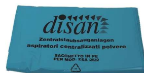
worki na śmieci ER 627