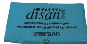
worki na śmieci ER 627