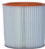
poliesterowy filtr dokładny ER 623