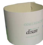
kartonowy rozpinacz worka ER 624