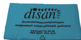
worki na śmieci ER 627