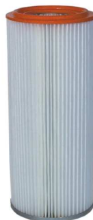
poliesterowy filtr dokładny ER 611