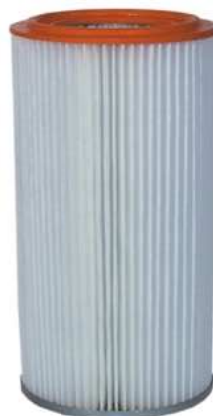
poliestrowy filtr dokładny ER 621