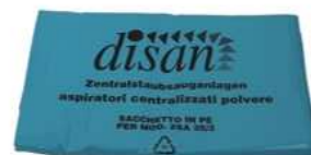
worki na śmieci ER 628+