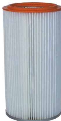
poliesterowy filtr dokładny ER 621