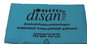
worki na śmieci ER 628+